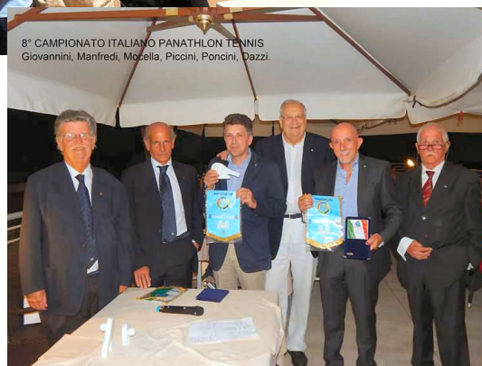
Una fase delle premiazioni